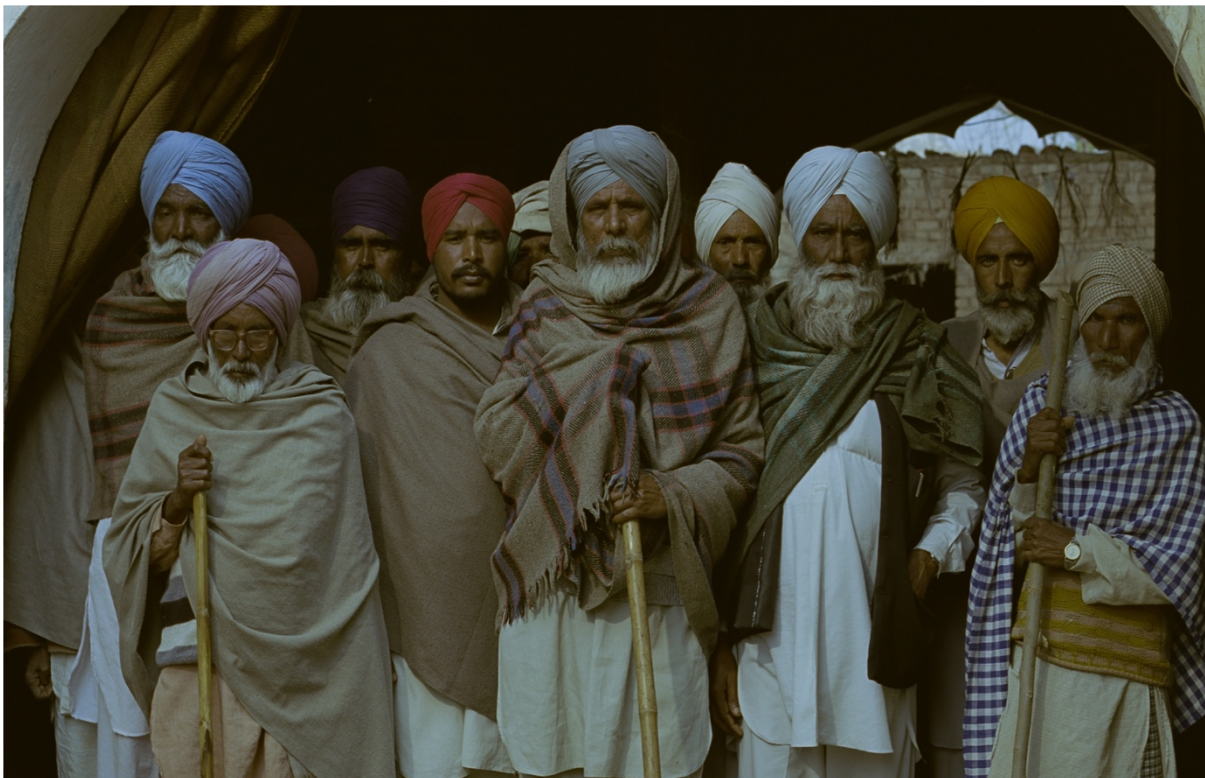
'ਅੰਨ੍ਹੇ ਘੋੜੇ ਦਾ ਦਾਨ' ਫਿਲਮ ਦਾ ਇਕ ਸੀਨ

2007 ਚ ਬਣੀ ਫਿਲਮ 'ਅੰਨ੍ਹੇ ਘੋੜੇ ਦਾ ਦਾਨ' ਇਸ ਰੁਜ਼ਹਾਨ ਤੋਂ ਨਿਆਰੀ ਹੈ। ਮੜ੍ਹੀ ਦਾ ਦੀਵਾ ਵਾਂਙ ਹੀ ਨਾਮੀ ਲਿਖਾਰੀ ਗੁਰਦਿਆਲ ਸਿੰਘ ਦੇ ਨਾਵਲ 'ਤੇ ਅਤੇ ਐੱਨ. ਐੱਫ. ਡੀ. ਸੀ. ਦੀ ਮਾਲੀ ਮਦਦ ਨਾਲ ਬਣੀ ਇਹ ਫਿਲਮ ਬੇਜ਼ਮੀਨੇ ਮਜ਼ਦੂਰ ਪਰਿਵਾਰਾਂ ਦੀ ਪਿੰਡ ਤੇ ਸ਼ਹਿਰ ਵਿਚ ਹੋਣੀ ਦੀ ਦਾਸਤਾਨ ਦਿਖਾਉਂਦੀ ਹੈ। ਸੁਸਤ ਚਾਲ ਚਲਦੀ ਇਹ ਫਿਲਮ ਦੇਖਣ ਵਾਲੇ ਨੂੰ ਸੋਚਣ ਲਈ ਮਜ਼ਬੂਰ ਕਰਦੀ ਹੈ, ਨੀਝ ਨਾਲ ਰਮਜ਼ਾਂ ਪਛਾਨਣ ਲਾਉਂਦੀ ਹੈ। ਇਸ ਫਿਲਮ ਨੇ ਬੌਕਸ ਔਫਿਸ ਤੋਂ ਕਮਾਈ ਤਾਂ ਨਹੀਂ, ਪਰ ਵਾਹ-ਵਾਹੀ ਬਹੁਤ ਖੱਟੀ ਹੈ। ਵੈਨਿਸ ਫਿਲਮ ਮੇਲੇ ਵਿਚ ਸ਼ੁਮਾਰ ਹੋਈ, ਆਬੂ ਧਾਬੀ ਫਿਲਮ ਮੇਲੇ ਤੋਂ ਇਨਾਮ ਜਿੱਤੀ, ਨੈਸ਼ਨਲ ਫਿਲਮ ਅਵਾਰਡ ਜਿੱਤੀ ਇਸ ਫਿਲਮ ਨੇ ਪੰਜਾਬੀ ਸਿਨਮੇ ਨੂੰ ਕੌਮਾਂਤਰੀ ਨੁਮਾਇੰਦਗੀ ਤੇ ਮਕਬੂਲੀਅਤ ਦਿੱਤੀ ਹੈ। ਇਸਦੇ ਬਹੁਤੇ ਕਿਰਦਾਰ ਗ਼ੈਰਪੇਸ਼ੇਵਾਰ ਆਮ ਪੇਂਡੂ ਨੇ ਜਿੰਨ੍ਹਾ ਦੀ ਪਰਦੇ 'ਤੇ ਪੇਸ਼ਕਾਰੀ ਦੇਖਣ ਵਾਲੇ ਨੂੰ ਪੰਜਾਬੀ ਪਿੰਡ ਦੇ ਦਲਿਤ ਵਿਹੜਿਆਂ ਵਿਚ ਪੁਚਾ ਦਿੰਦੀ ਹੈ। ਧੂਨੀ ਤੇ ਤਸਵੀਰਸਾਜ਼ੀ ਦੇ ਸੁਮੇਲ ਨਾਲ ਸਿਰਜੇ ਚਿਤ੍ਰ, ਚਲੰਤ ਫਿਲਮਸਾਜ਼ਾਂ ਨੂੰ ਸੋਚਣ ਲਈ ਮਜ਼ਬੂਰ ਕਰਦੇ ਹਨ। ਆਉਣ ਵਾਲੇ ਸਮਿਆਂ ਵਿਚ ਬਹੁਤ ਸਾਰੀਆਂ ਫਿਲਮਾਂ ਇਸ ਫਿਲਮ ਦੇ ਦਾਅਪੇਚਾਂ ਤੋਂ ਸੇਧ ਲੈਂਦੀਆਂ ਨੇ। ਪਰ ਵਿਸ਼ੇ ਵਸਤੂ ਵਾਲੇ ਪਾਸੇ ਮੋੜਾ ਪਾਉਣ ਹਲੇ ਲੰਮੀ ਖੇਡ ਹੈ।