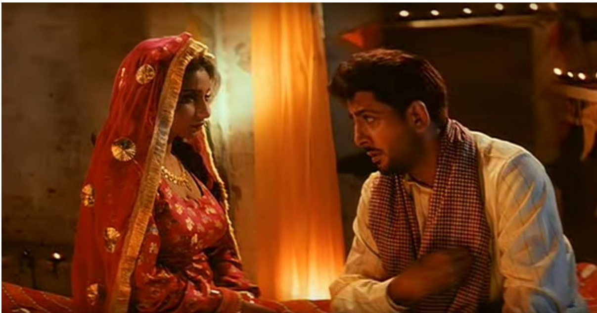
ਸ਼ਹੀਦ-ਏ-ਮੁਹੱਬਤ ਵਿਚ ਜੈਨਬ ਅਤੇ ਬੂਟਾ ਸਿੰਘ ਦੇ ਕਿਰਦਾਰ ਵਿਚ ਦਿਵਿਆ ਦੱਤਾ ਅਤੇ ਗੁਰਦਾਸ ਮਾਨ