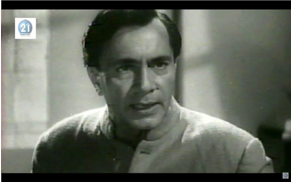
'ਸਤਲੁਜ ਦੇ ਕੰਢੇ' ਵਿਚ ਬਲਰਾਜ ਸਾਹਨੀ