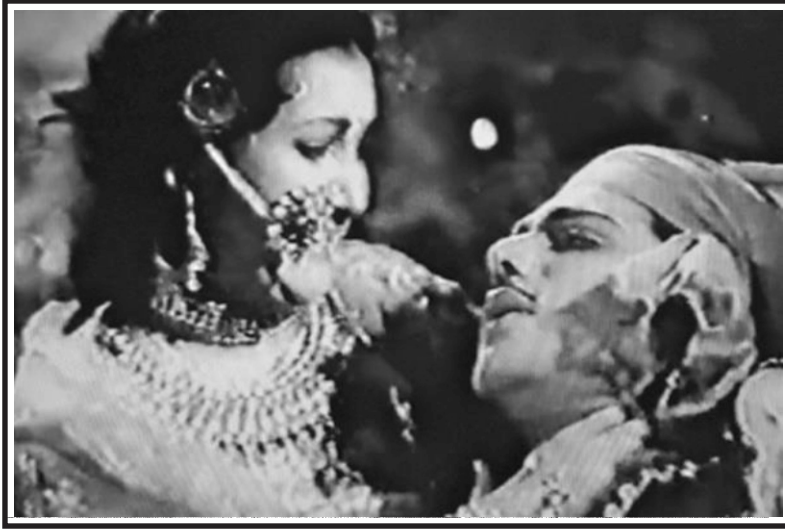
(نور جہاں تے تر لوک کپور 1947 وچ بنی فلم مرزا صاحبان وچ)

کھچ کھچ ماردا کانیاں دتی نیوں لکانا دی پٹ وڈے وڈے مر گئے سورے مارتے پنچتت اوہ ناردا بے میں کلا مرزا مر گیا تاں کیا سنی ہو جاؤ ستھ؟