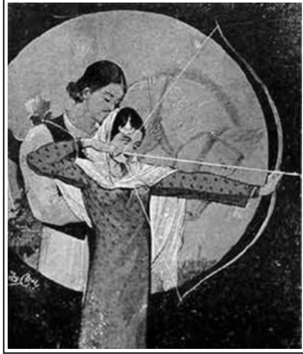
(سو بھانگھ دی سن 1960 دے نیڑے بنائی مرزا صاحبان دی تصویر)

چُپ کر گئیاں پیبیاں حسنِ حسینِ کہا منی رضا پیغمبروں حافظ توں وی من رضا سوشہیداں نوں کر بلا تیوں کھیوا ساڈے بھا، (حافظ برخوردار)