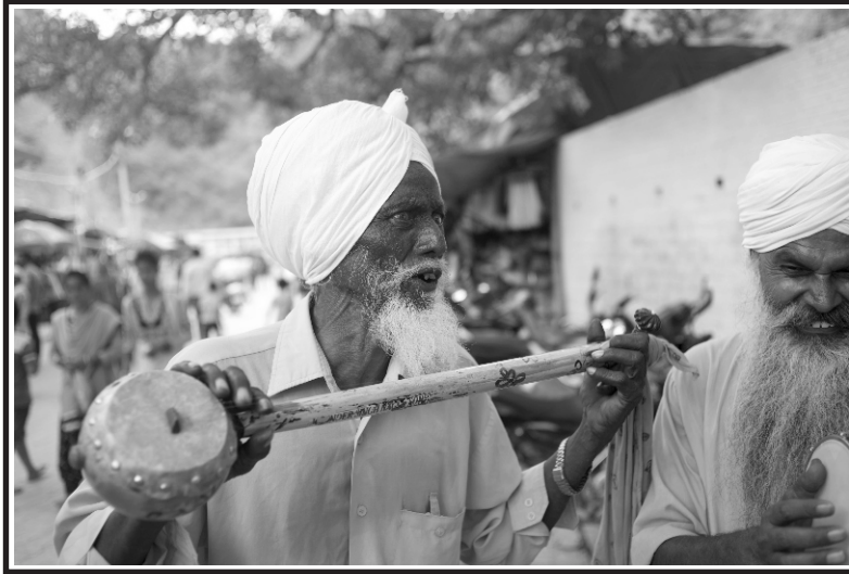
گُر دیپ دھالیوال دی کچھی پالے دی تصویر (ہری پُر، 2019)

جیہناں دے درگا ہی ویاہ نوں توڑن واسطے راون ورگے شمیر دی فوج اوہناں اُتے حملہ کر دیندی ہے۔ پریت قصے وچ مقامی مذہب دی رنگت نال قصے وچ اضافہ ہوندا ہے تے لوکا ئی وچ رامائن دیاں ساکھیاں وی پکیریاں ہوندیاں ہن۔ سارے مذہباں دیاں حدان دا خیال وی رکھیا جاندا ہے، قرآن پاک اکاں دے پیتاں دی ہے۔ انگد، پنڈت راون توں پیریں ہتھ لوا کے اپنے سر پاپ نہیں لینا چاہندا۔ دوجے پاسے مذہب دیاں وگلناں نوں موکلا کر کے سارے پیر فقیر دیوی دیوتے اکوتھاں اکٹھے ہو سچے عشق دی لڑائی وچ جٹے مرزے نوں سولھاں کلاں سنپورن کر دیندے ہن۔